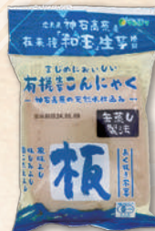
有機生芋蒟蒻(板) 4790 275g 302円(280円)