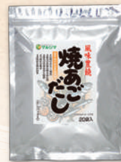
焼きあごだし 2165 8g×20 1,566円(1,450円)