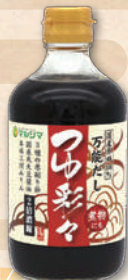
つゆ彩々 2078 400ml 961円(890円)