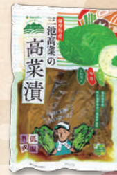
三池高菜の高菜漬 5577 250g 583円(540円)