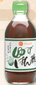
ゆずぼん酢 1761 300ml 653円(605円)