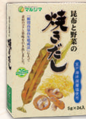
昆布と野菜の焼きだし 2185 5g×24 1,058円(980円)