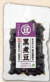
黒煮豆 4032 120g 475円(440円)