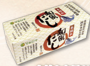
本枯れ和風だし 2007 8g×24 1,399円(1,295円)