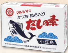
かつおだしの素 2002 10g×50 1,650円(1,528円)