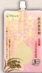
国内産有機玄米甘酒 ストレート