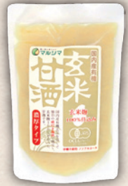
国内産有機玄米甘酒 濃厚タイプ