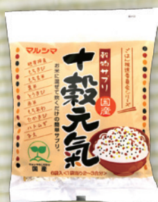
国産 十穀元氣 25g×6 616円(570円)