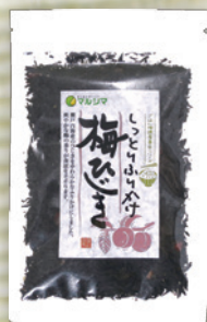
しっとりふりかけ 梅ひじき 40g 329円(305円)