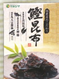
佃煮屋のこだわり 鰹昆布 100g 702円(650円)