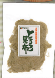
とろろ昆布 40g 313円(290円)