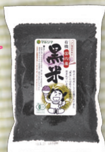
国内産 有機黒米 200g 486円(450円)