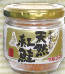
手ほぐし天然紅鮭 60g 594円(550円)