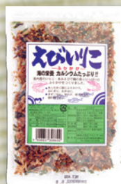
えびいりこふりかけ 40g 356円(330円) (30gに変更予定)