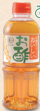
有機米でつくった おいしいお酢