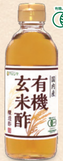
国内産 有機玄米酢