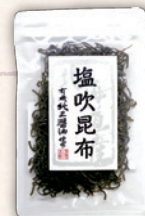
塩吹昆布 35g | 460円(416円)

付け合わせとして塩気のあるものはいかがでしょうか？ 北海道産昆布を有機醤油などを使って炊きあげ乾燥させた小豆島の塩吹昆布です。