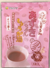
あずきちゃんしょうが湯 15g×4 346円(320円)