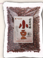
国産有機小豆 200g | 670円(620円)

小豆2に対して粗糖1程度を用意。小豆がやわらかくなるまでゆでたらひたひたの煮汁を残して粗糖、少量の塩を加え、適当な固さになるまで煮つめる。甘さはお好みにより調整してください。