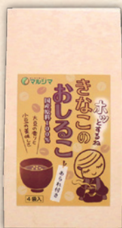
きなこのおしるこ 60g(15g×4) [あられ4g付] 486円(450円)

大晦日には「年越そば」、三が日には「おせち」や「お雑煮」、1月7日には「七草がゆ」を食べますが、年初めの鏡開きの日には「おしるこ」を食べる習わしがあります。