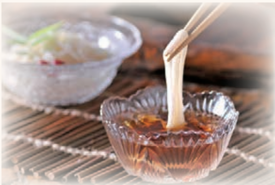
つゆ彩々 400ml 810円 (750円)

夏の時期に何となく食べていたそうめんですが、実は神様に備えることで崇りが起こらないように祈り、先祖供養をする食べ物でした。このような背景がわかると、より味わい深くいただくことができると思います。七夕の夜は体調を整え家族や自身の健康を祈ってはいかがでしょうか。