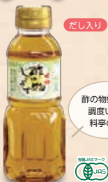
有機酢の物じょうず 300ml 580円 (537円) 甘み ★★★★★ 酸味 ★★★★★