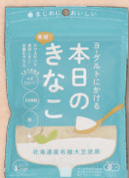
2818 ヨグルトにかける本日のきな粉 275円(255円)