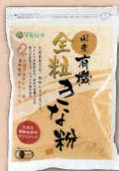
2570 国産有機全粒きな粉 365円(338円)