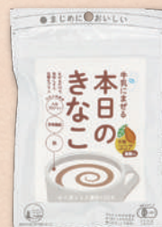
2869 ココア 319円(295円)