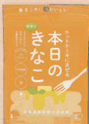
2815 ホットケーキにまぜる本日のきな粉 275円(255円)