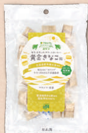
3298 黄金きなこ飴 397円(368円)