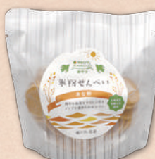
3973 米粉せんべいきな粉 410円(380円)