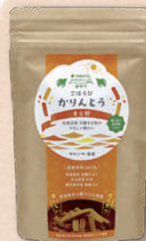
6012 ごぼうびかりんとうきな粉 378円(350円)