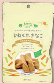
9010 ひねくれきなこ 313円(290円)