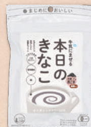
2868 黒ごま 319円(295円)