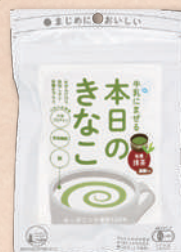
2894 抹茶 351円(325円)