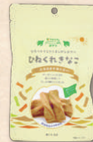
ひゆくれきなこ 9010 335円(310円)