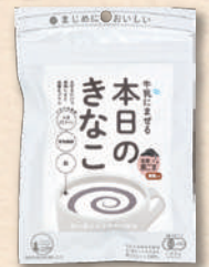
黒ごま 2868 319円(295円)