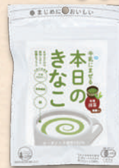
抹茶 2894 351円(325円)