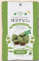
抹茶きなこ飴 3393 443円(410円)