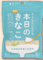
ヨーグルトにかける 本日のきなこ 2818 275円(255円)