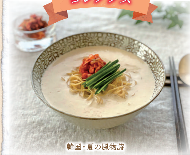
韓国・夏の風物詩

しっかり冷やした濃厚な豆乳スープでいただく冷麺のレシピです。マルシマの「国産有機全粒きな粉」をたっぷり入れました。そうめん、ひやむぎなどお好みの麺で作ってみてください。