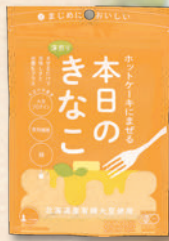
ホットケーキにまぜる 本日のきなこ 2815 275円(255円)