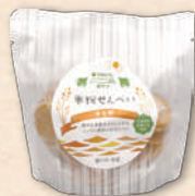
米粉せんべいきな粉 3973 454円(420円)