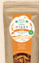
ごぼうびかりんとうきな粉 6012 378円(350円)