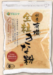
国産有機 全粒きな粉 2570 365円(338円)