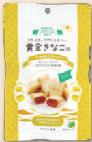
黄金きなこ飴 3298 416円(385円)