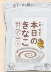
ココア 2869 319円(295円)