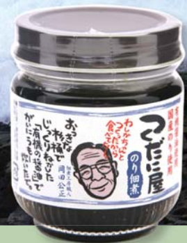
つくだに屋 のり佃煮(95g) 420円(税込)

醤油がしっかり効いている昔ながらののり佃煮です。醤油の効いた味は、酒の肴や辛口の方におすすめです。なめらかな口当たりも特徴です。