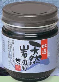
天然岩のり(100g) 431円(税込)

素材の「岩のり」の風味が際立って、甘み、辛み、旨み、香りとも絶妙なバランスです。とろりとしたなかでものりの歯ごたえを感じます。また磯の香りが生きており、食欲をそそります。