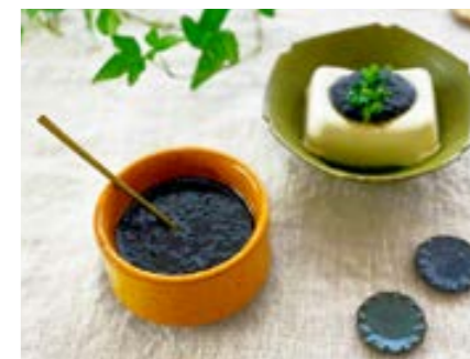
冷奴や野菜、魚やお肉、 ごはんや麺のタレにも 万能黒ごまタレ