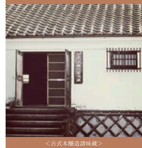
<古式本醸造諸味蔵>