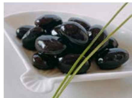
国産有機黒豆と 有機純正醤油で作る 黒豆