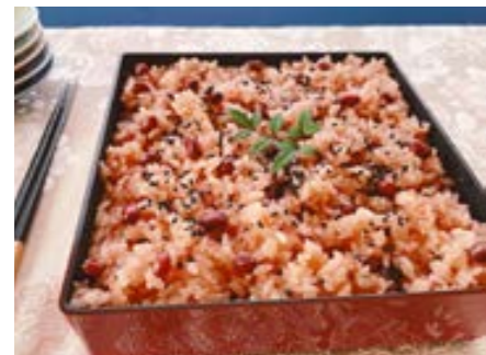
失敗しない！炊飯器で炊く お赤飯