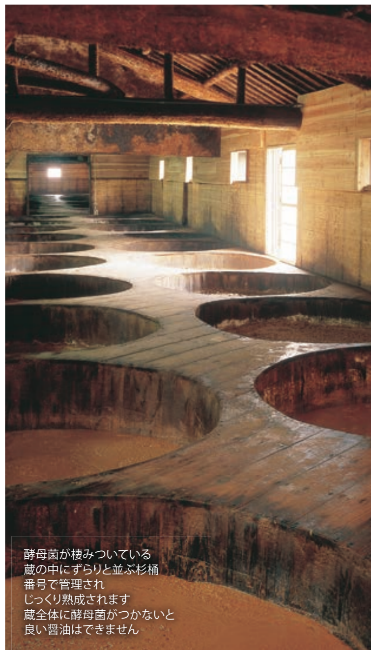
酵母菌が棲みついている蔵の中にずらりと並ぶ杉桶番号で管理されじっくり熟成されます蔵全体に酵母菌がつかないと良い醤油はできません

のある「丸大豆」や自然との共存を目指す「有機農産物」にこだわり微生物の力を最大限に生かした「製法」にこだわって造っております。さらに、三十石の大きな杉桶を使い、天然醸造にて、じっくりと時間をかけて熟成させた杉桶仕込みのお醤油は、味、コク、香りの3つがバランスよく際立っています。伝承の味をぜひ1度ご賞味ください。