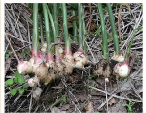
色鮮やかな有機生姜

◎冷奴に、お刺身、魚・肉のたたき、生姜焼き、お漬物など、いろいろなお料理にお使いいただけます。また、隠し味としてカレーやチャーハンなどにもお使い下さい。