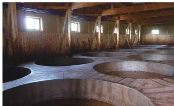
酵母菌が棲みついている蔵の中にずらりと並ぶ杉桶